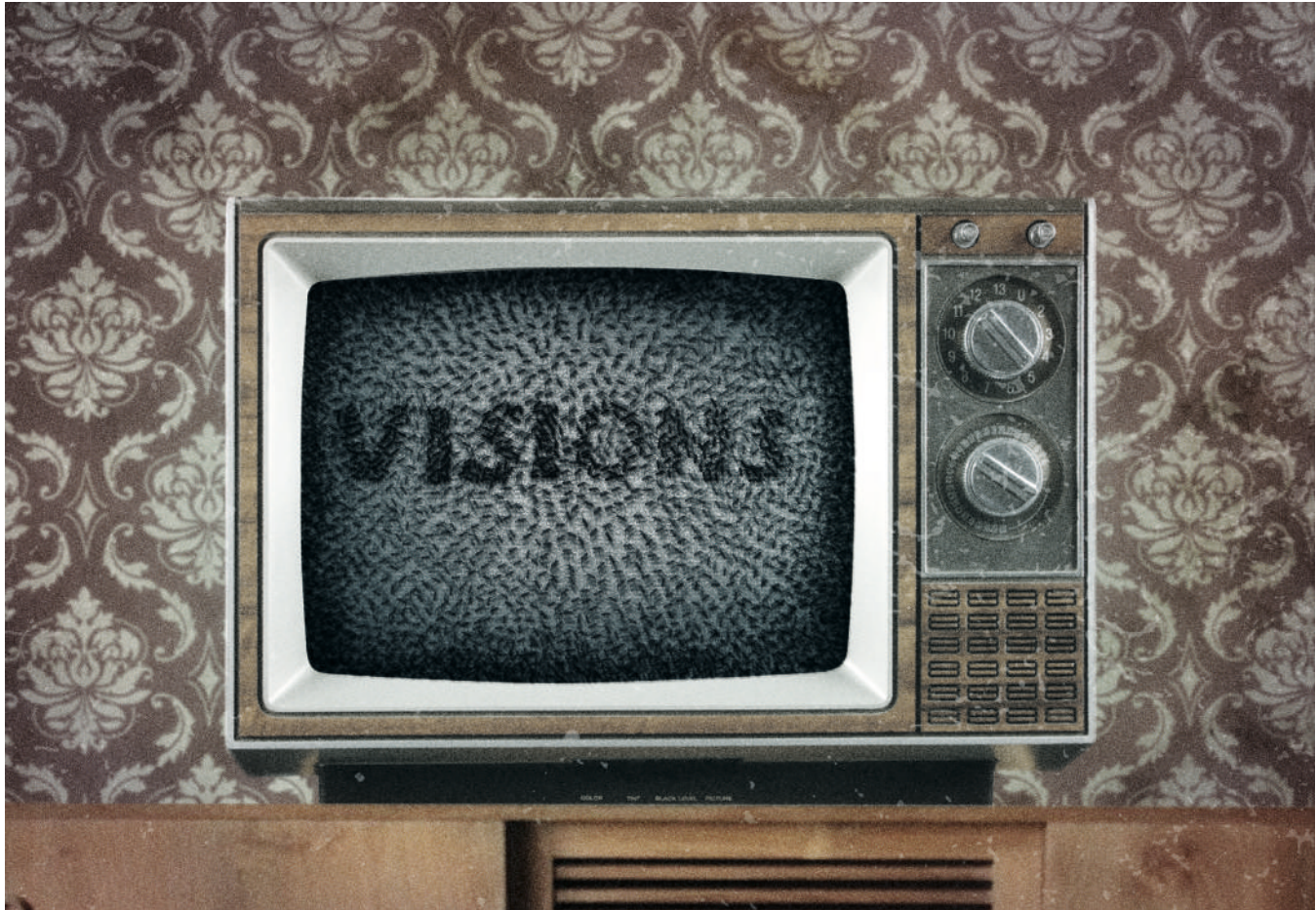
ILLUSTRATION: JULIE CONRAD. BASED ON AN IDEA BY CLAIRE THILL