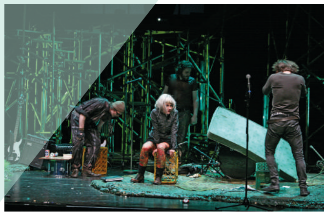
IMAGES ZOO STORY - 2006 | PEANUTS - 2011 MAMMOTHUS EXILIS - 2008 | DIE TERRORISTEN - 2008